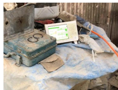
デマンド制御も実施