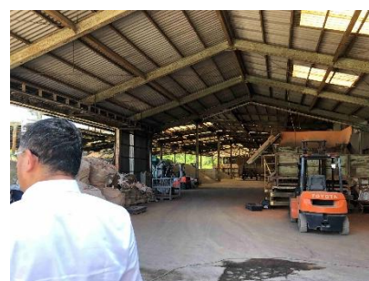
原料の保管、配合を行う建屋