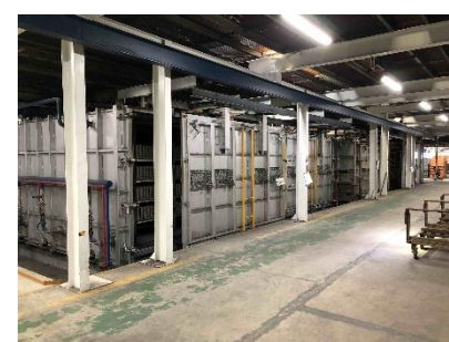
レンガ焼成窯(全10機)