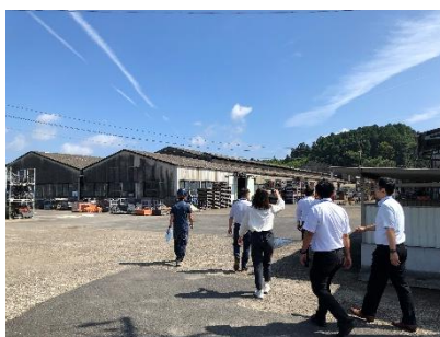
敷地内に5つの建屋があります