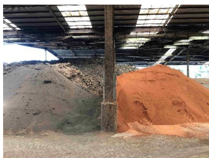
新燃岳の灰、バイオマス珪素も原料に