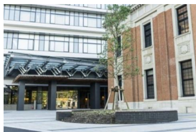
宮崎県防災拠点施設

現在は、公共工事とりわけ歩道整備等に使用される焼成レンガの製造・施工・販売を通じ、地域の景観整備とインフラ基盤構築に寄与しています。歩道や建物へのレンガ製造施工には以下のような実績があります。