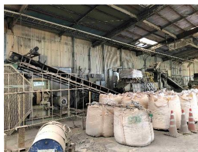
主原料である粘土と骨材を砕き配合