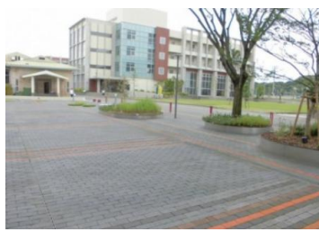
九州女子大学 外構