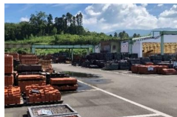
敷地内にあるレンガ市場 (春と秋には特売会が開催される)

また脱炭素の取組みは「未来に対する投資」と捉え、現在以下の事柄に取り組んでいます。