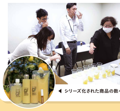
シリーズ化された商品の数々