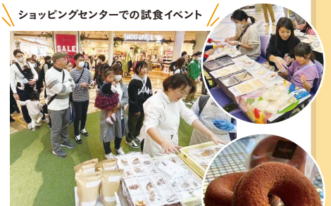
餃子包み教室の様子▶上 県産小麦を使用したドーナツ▶下

連携事業者 農林漁業者、食品加工業者、小売業者、飲食店、ショッピングセンター、広告デザイン業者、大学