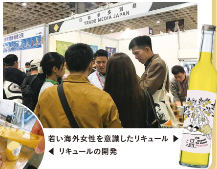
若い海外女性を意識したリキュール リキュールの開発