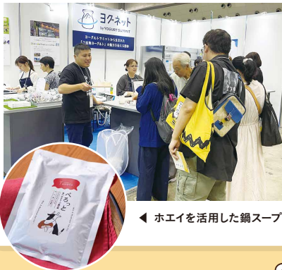
ホエイを活用した鍋スープ