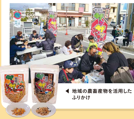
地域の農畜産物を活用した ふりかけ