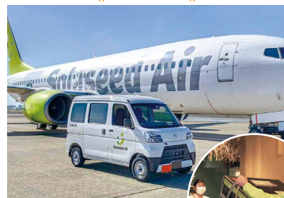
その日のうちに宮崎から東京へ▶