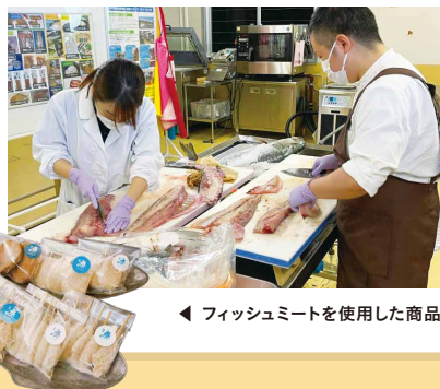
フィッシュミートを使用した商品