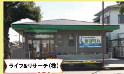
ライフ&リサーチ(株)

美味しい「地域素材を十分に活かす美しい商品づくり」をテーマに、食品製造販売と商品開発支援の事業を創業されました。