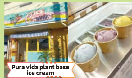
Pura vida plant base ice cream

家で毛染めする際の、服汚れ防止用のフード付きケープの製造・販売。何度でも使えるセルフヘアカラーの強力なグッズです。宮崎で製造して発信します。