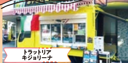
トラットリア キジョリーナ