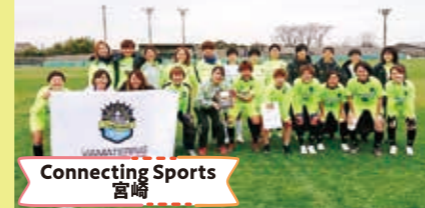
Connecting Sports 宮崎

インバウンドの浮揚、在住外国人のコミュニティの場を提供するため、エッグタルトの美味しい香港テイストのカフェを開業しました。