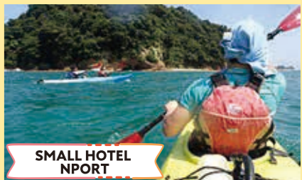
SMALL HOTEL NPORT

えびの市で空き家を活用して古民家カフェと農家民宿を開業、自家製発酵食品と無農薬ハーブの美味しい料理を提供、ハーブ雑貨作り体験もできます。