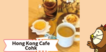
Hong Kong Cafe Cokk

地域活性化のために高原町へ移住。目の前に霧島が広がる地に、焼き立てのパン・スイーツのカフェ&デリカテッセンのお店 (事業承継) を開業しました。