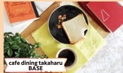
cafe dining takaharu BASE

フェムテックで女性が快適に生活できる、超吸収サニタリーショーツ (QUARTER) の製造・販売を起業しました。(女性起業家ビジネスコンテストグランプリ)