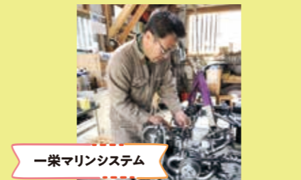
一栄マリンシステム

若い世代の定住・移住を推進するため子育て世代の支援 (学習、活動支援・自然体験活動)、IT利用の情報発信、東米良地区山村の活性化を目指しています。