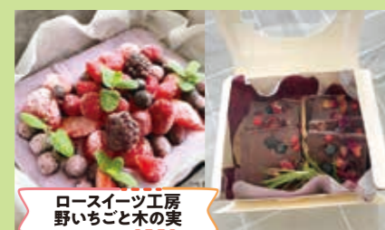
ロースイーツ工房 野いちご木の実

高齢者も安心して食べられる油を使わない中国水餃子の製造・販売。中国水餃子のカルチャーを発信して、地元食材消費、雇用の拡大を目指します。