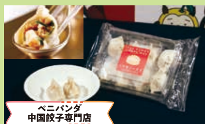
ベニバンダ 中国餃子専門店

地域食材を用いたスイーツの開発、フードコーディネート、台湾貿易を展開するため創業、地域食材を用いた月餅 (台湾スイーツ) を開発しています。