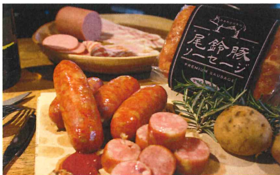
"PREMIUM PORK 尾鈴豚"