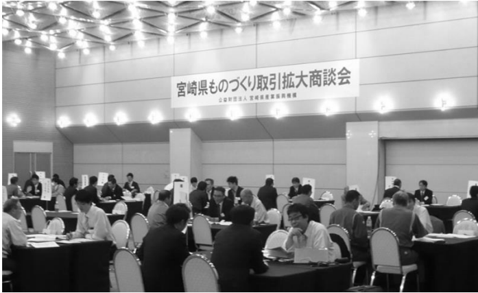
▲取引相談会の様子

機構が取り組む県内中小企業の取引支援事業のメインイベントともいえる「ものづくり取引拡大商談会」（宮崎）を、平成27年11月12～13日の2日間にわたり開催しました。