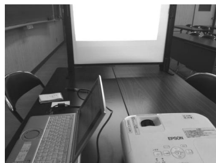
▲プロジェクターに写しながら事業計画を策定